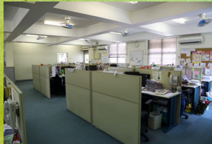
Staff Room (教員室)