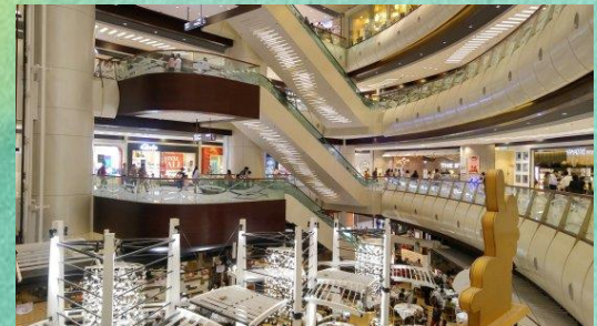
Shopping Mall (購物中心)