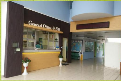
General Office (校務處)